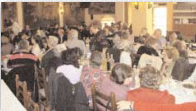
Κατάμεστη η ταβέρνα του Κρητικού στην Πλάκα. Οι κάτοικοι της περιοχής μας τίμησαν με την παρουσία τους και συμμετείχαν ενεργά στη λαχειοφόρο αγορά που ακολούθησε για την ενίσχυση του Συλλόγου μας.