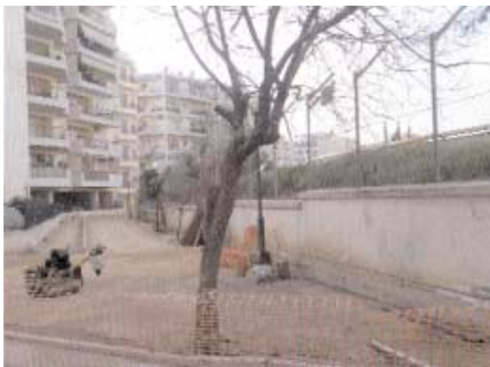
Τα έργα έχουν αρχίσει... Δυστυχώς η πεζοδρόμηση στο σημείο που την κάνουν δεν εξυπηρετεί κανέναν. Αλήθεια κανείς δεν πήγε στην περιοχή να δει με τα μάτια το έργο;