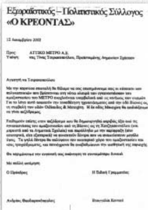
Από το 2002 ζητούσαμε από την ΑΤΤΙΚΟ ΜΕΤΡΟ Α. Ε. να τοποθετηθούν ηχοπετάσματα, αλλά πέρα βρέχει...