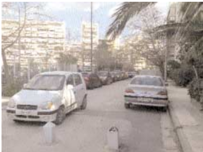
Η Μετοχίτου λειτουργεί ως... πάρκινγκ αυτοκινήτων. Μικρά πεζοδρόμια που δυσκολεύουν την πρόσβαση των μαθητών και ασφαλτόστρωση χάλια...