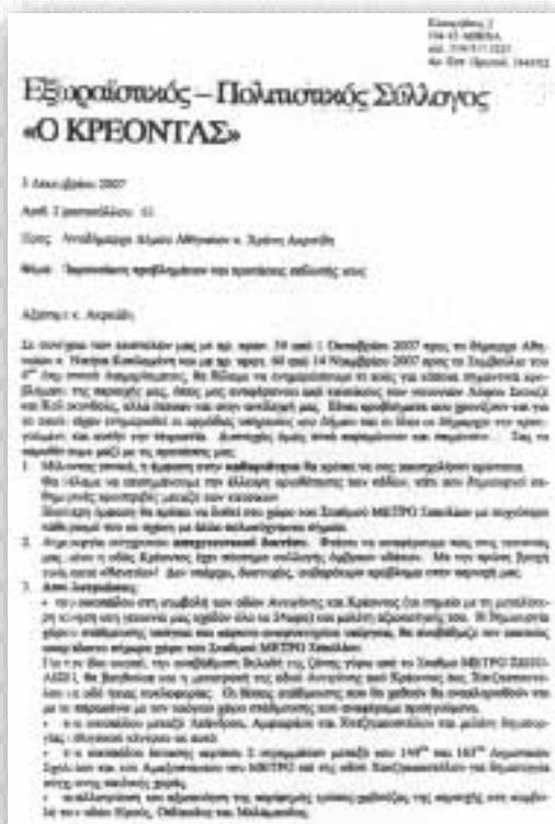
Με συνεχή έγγραφα μας στις αρμόδιες υπηρεσίες του Δήμου Αθηναίων καταγράφουμε τα προβλήματα στην περιοχή και ζητάμε λύσεις. Και τι έγινε; Κανείς δεν μας ακούει...