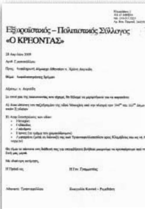
Ένα ακόμα έγγραφο - υπόδειξη για τα επείγοντα έργα που χρειάζεται να γίνουν στην περιοχή μας.