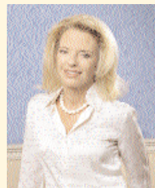
Άρθρο της βουλευτού Α Αθηνών Ν.Δ. Ελίζας Βόζεμπεργκ

Μεταρρύθμιση μόνο με καλές προθέσεις δεν μπορεί να γίνει.